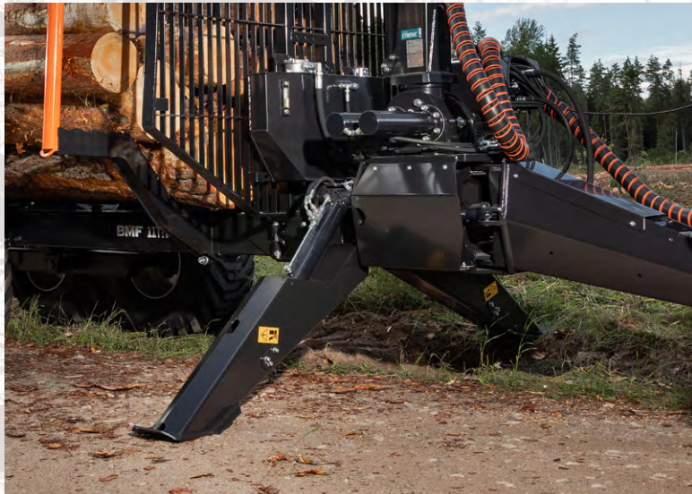
Béquille FD (Pantographe)