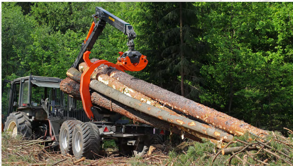
Clambunk pour les modèles 12T2 et 14T2