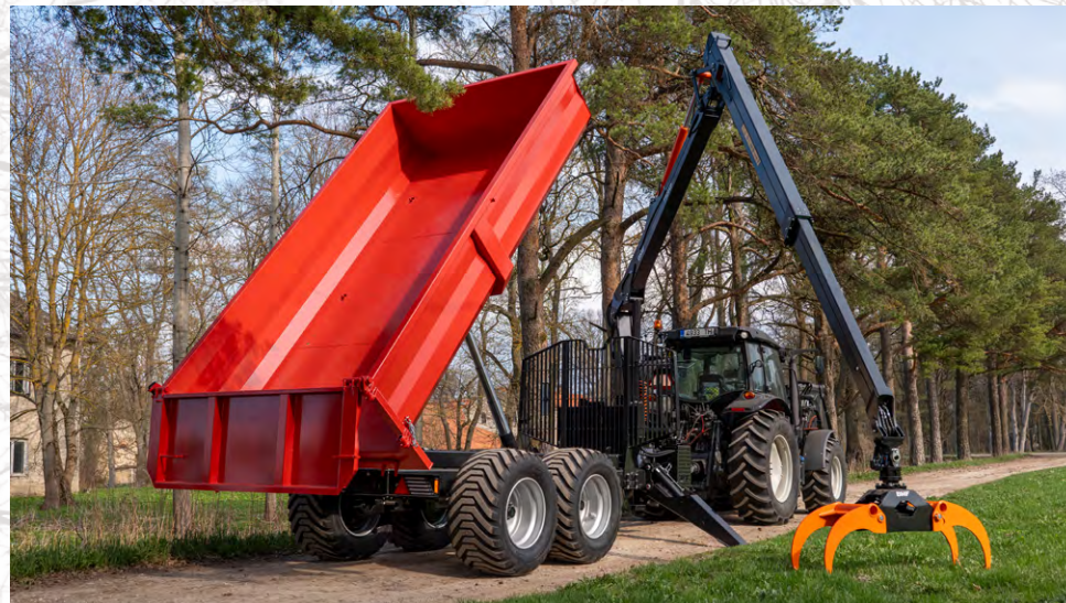
Benne basculante pour les modèles 12T2 et 14T2