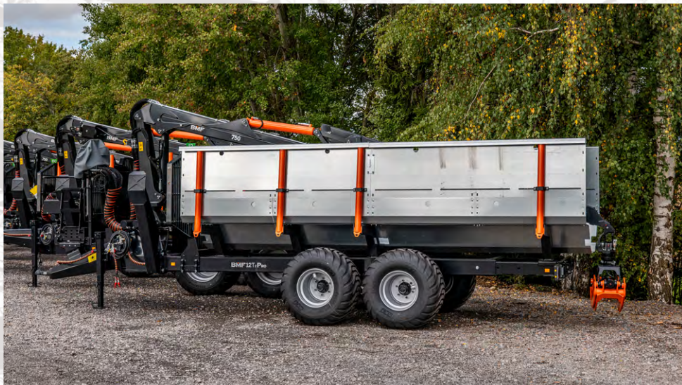
Bac à branches