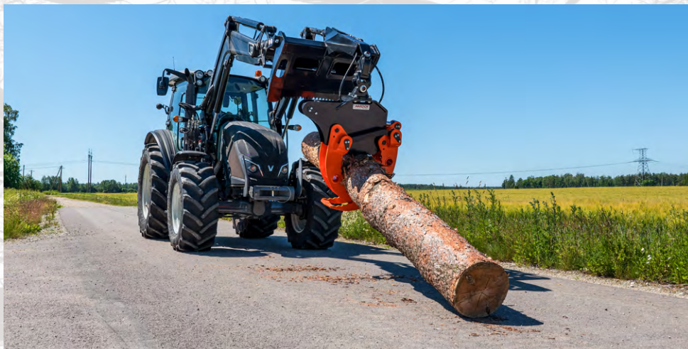
Pince de débardage de grumes frontale et 3 points F1000