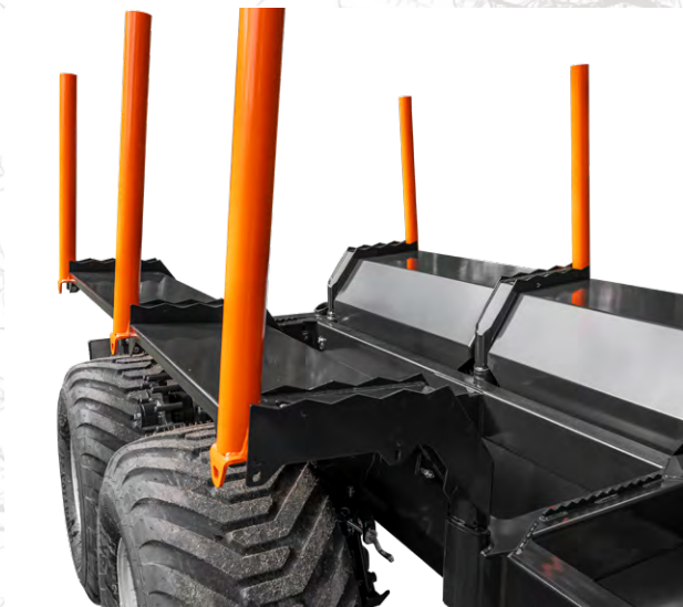
Plaques de cargaison