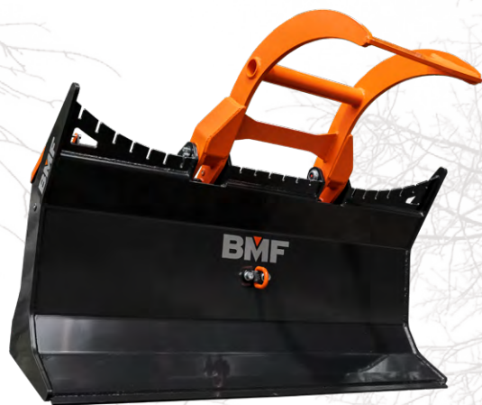
Lame frontale de débardage avec options au choix