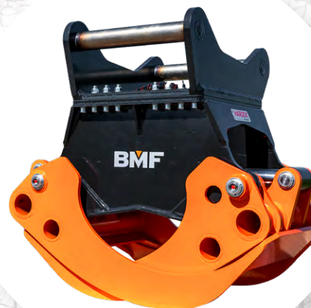
Adaptateur pour pelleteuse