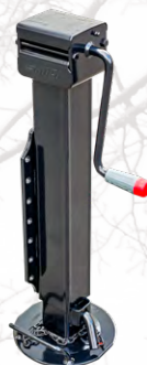
Cric pour remorque