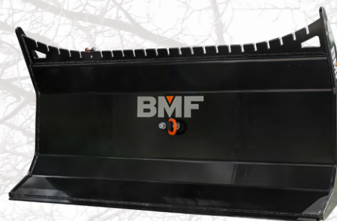
Coffre forestier avec treuil en option